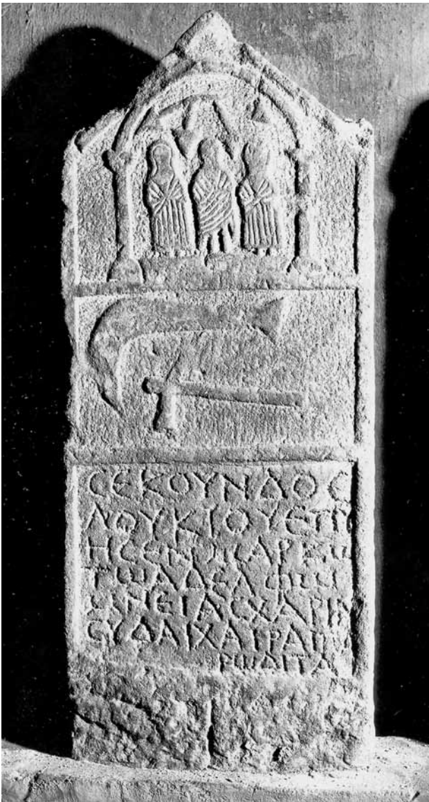
Сл. 4. Надгробна стела од Кавадарци.

речко население. Ова се поткрепува и со фактот дека во оваа област, како и во цела Македонија, не се најдени траги од келтска култура. Доволно е да се потсетиме на келтското населување во југоисточна Бугарија, при што е формирано и кралство со престолнина во Tyllis, 30 што е многу добро посведочено со археолошките ископувања.