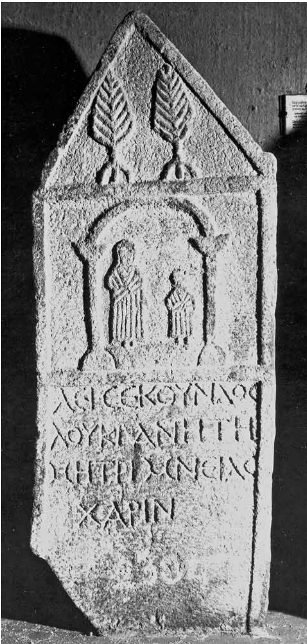
Сл. 7. Надгробна стела од Кавадаречко.