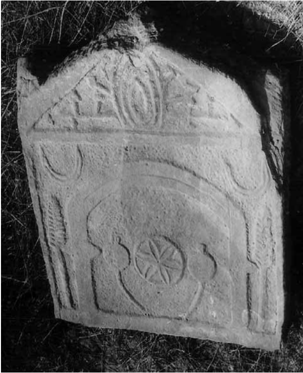
Сл 12. Горен дел од надгробна стела, с. Д. Дисан.

мени прво од питагорејците, потоа од стоиците што ги рашириле низ целото Римско Царство, а се разбира дека не им биле туѓи ниту на манихејците 89 кои, паганските верувања на Семитите од Месопотамија, каде што всушност поникнало манихејството, ги приспособиле на нивното учење. 90 За правилно толкување на оваа иконографија многу е важно да се има на ум и многу добро познатиот факт дека скулпторите работеле според готови, однапред изработени шеми што кружеле низ целата територија на Римското Царство и дека мајсторите понекогаш не го разбирале нивното значење, туку работеле по порачка и многу често ги изработувале механички. Но исто така треба да се знае дека на барање на нарачателот скулпторите можеле да ги менуваат шемите или пак да ги приспособуваат на локалните религиски верувања. Тоа покажува дека не треба по секоја цена да се бара есхатолошка симболика на секоја стела со мотив на розета или диск, зашто ако се сака, на секој мотив може да му се даде некакво симболичко (религиско, космичко и др.) значење, и научникот е тој што треба да процени дали станува збор за обичен декоративен мотив или за мо-