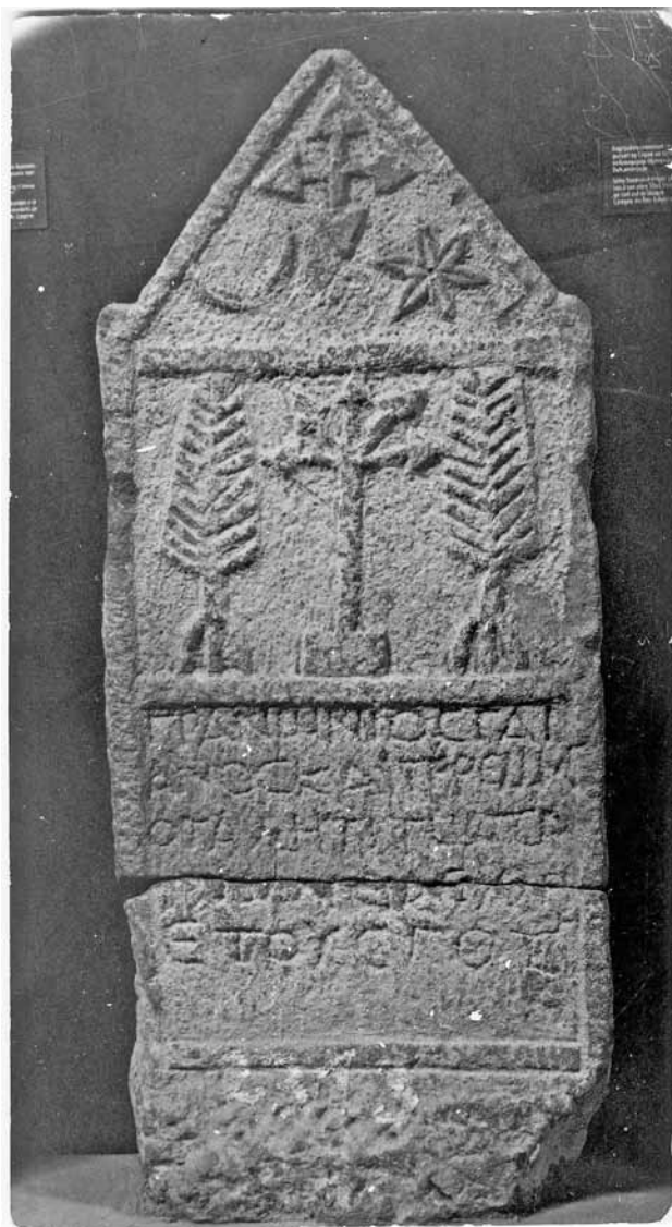
Сл 2. Надгробна стела од Кавадаречко.

на едната од нив има натпис, веројатно епитаф на покојниот. 14 На две стели од оваа варијанта покојните се означени со тнр. грчко-македонска формула чиј еден елемент е римско име ( Ausonius , Loukios , Markosm Seilenos , Sekoundos ) што го покажува влијанието на староседелците ( Dioskore , Soterichos ) врз “туѓинците” 15 Во случајов тоа се