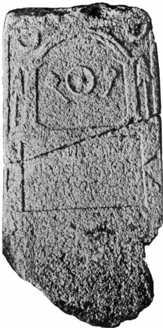
Сл. 3. Надгробна стела од с. Ресава.

или пак на различни гностички учења. 23 Во оваа пригода, накусо ќе ги прикажам досегашните мислења што веќе ги имам коментирани во споменатите статии на француски јазик, а за првпат ќе ја анализирам најновата теорија за манихејска припадност на овие стели. Притоа сакам веднаш да истакнам дека за ни една од досега искажаните теории нема никакви индикации, а камоли докази, ниту во пишаните ниту во археолошките извори. Теоријата дека станува збор за траги од присуство