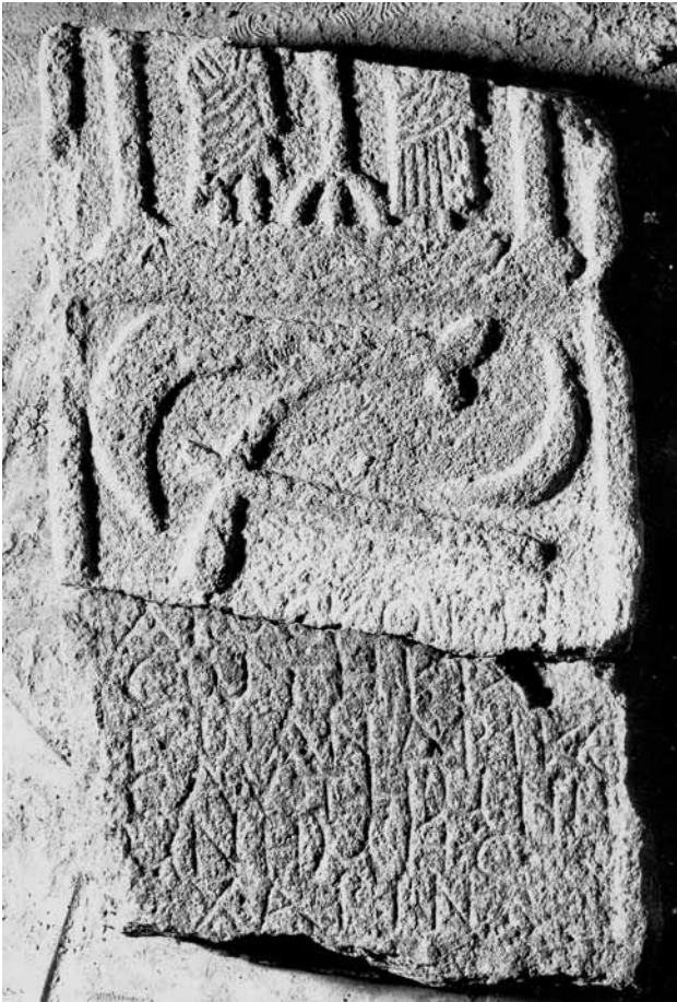
Сл. 6. Надгробна стела од Кавадаречко.

рово дрво 46 или шишарка поставена на ара, 47 станува збор за своевидна хероизација на покојните, прикажани преку секогаш зеленото дрво затоа што зимзелените дрвја биле фунерарен симбол за бесмртност и вечен живот. Дека тоа е така, се гледа од епитафот на стелата од Прилеп/Прилепец, каде што покојниот е наречен heros 48 , како и на една необјавена стела во Музејот во Велес (сл. 8) Стелата е најдена во с. Белештевица, дим. 0, 84 x 0,42 x 0,15 м, скршена на два дела при што недостига речиси целата десна половина од релјефното поле и горниот десен агол од натписното поле. Во релјефното поле е зачувана машка фигура со волумен во левата рака и мал дел од главата на друга фигура. Во горниот агол на фронтонот е прикажана шишарка врз ара, во средината сончева розета во круг, а од страната цвет, додека десниот агол е откриен. Во профилираното натписно поле испишан е епитаф во девет реда: