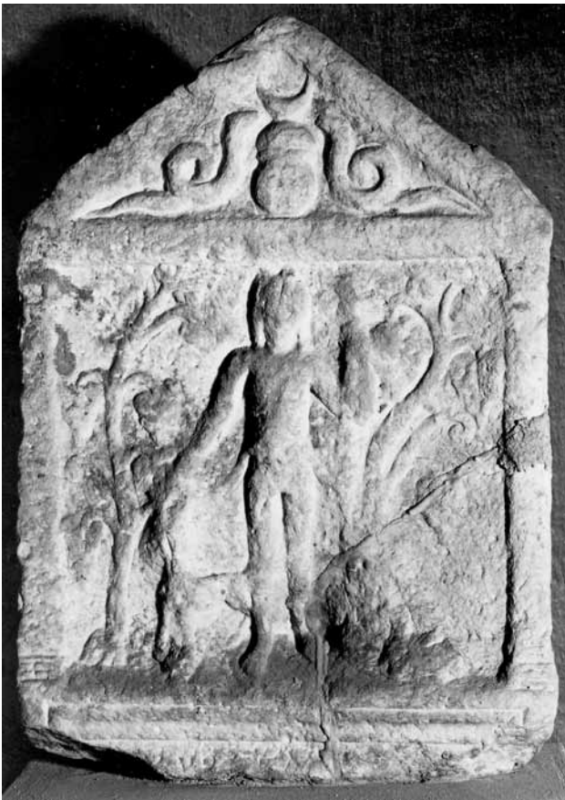
Сл. 11. Стела од Битола.

најблаго речено е несериозено. Така, наместо вообичаените стручни термини Авторот користи цели реченици, при што таквите описни означувања се несмасни и неразбирливи, што може да се види од следниве примери: сноп од стрелки што се спуштаат кон човечките фигури; крст со краци кои завршуваат во вид на стрелки; сложен склоп од меѓусебно поврзани стрелки; три листовидни мотиви поместени еден во друг; кружни мотиви со впишана розета со прекрстувања или со централен кружен мотив; гранче со топчест плод; прстен со или без крукче на средината со три додатоци во форма на стрелка; вертикален стожер со правоаголно проширување во основата и сноп од стрелки кои зерачесто се шират од врвот; брановидна т.е. цик-цак стрелка, ... Дека еден мотив не е тоа што мислат сите дека е, не се докажува со избегнување на името со кое тој се означува во стручната литература, туку со факти