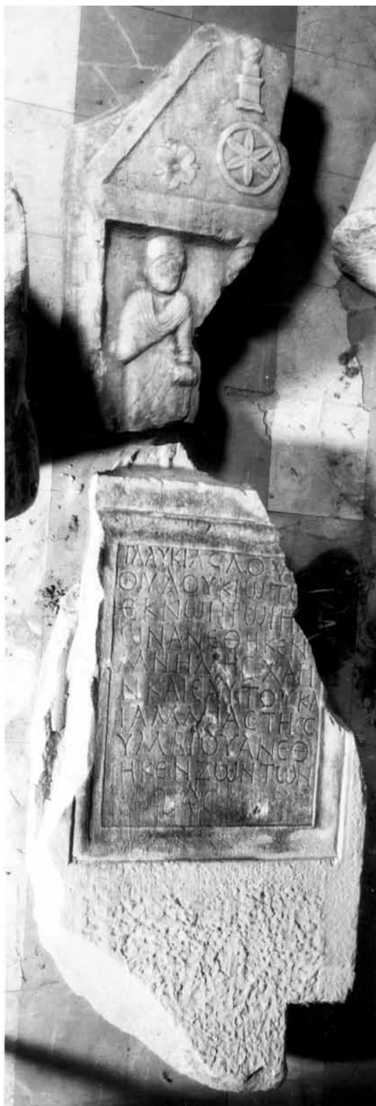
Сл. 8. Надгробна стела од с. Белештевица.

споменици од т.н. « кавадаречка група » in Македонско наследство/Macedonian heritage , IV/11, 1999, 3-78, препечатена во неговата книга Дуалистички слики , Скопје, 2003, 21-77, со додаток VI и VII 79-87, summary, 417-426. Книгата е објавена со средства од Министерството за култура, те. на даночните обврзници, но без стручна рецензија, што е спротивно на законот.