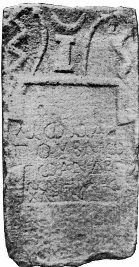
Сл. 10. Надгробна стела од с. Крушица.

на стелите - имено, во античко време нема надгробни споменици без натпис! Натписите, со ономастичките и палеографски елементи што ги содржат, се незаменлив елемент за анализа и за добивање релевантни научни резултати. Имињата на покојните, пак, ја покажуваат нивната етничка припадност (староседелци или доселеници, како на пр. римски колонисти), социјална или културна припадност и ги покажуваат не само патиштата на влијанија туку и на културна интеракција. Имено, доселениците во Македонија не само што влијаеле туку и тие трпеле влијанија од домашната средина. Така на пр. не само што « морале » да го користат јазикот на писменоста - грчкиот, туку прифатиле и некои домашни иконографски мотиви. 76 Дури и еден површен преглед на натписите на нашиве стели покажува дека тие се пишувани во типичната тнр. грчко-римска традиција: епитафите завршуваат со mnemes harin , една од најбазалните формули во фунерарната епиграфика од претхристијанско време. Нема манихејски формули ниту каков и да е друг показател за манихејска припадност на покојниците на овие стели. Авторот (имплицитно) тврди дека доселеници од