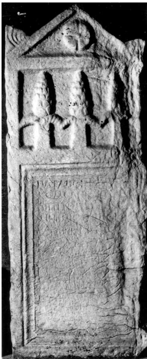
Сл. 5. Надгробна стела од Волково.

на семејството Granonni (сл. 2) како еден вид трофеј, дрво-трофеј, при што признава дека не му е јасно значењето на овој симбол. 38 М. Ренар и К. Деру прифаќаат дека овој симбол е дрво-трофеј, односно дрво речиси целосно оголено од гранките и од лисјата и дека краевите на гранките што останале веројатно се приказ на бршленови лисја како симбол на вечноста. Според нив, мотивот во горниот агол на фронтонот, ист како и “гранките” на дрвото-трофеј, ги сугерирале четирите годишни времиња и бидејќи Кибела е божица со четири лица ( Meter tetraprosopos ) тие го толкуваат овој мотив како апстрактен симбол на Кибела од двете страни придружена со по еден Атис-во вид на бор. 39 Подоцна е најдена уште една стела на лок. Белград кај Кавадарци со иста иконографска шема (дрво-трофеј помеѓу две други дрвја) овој-